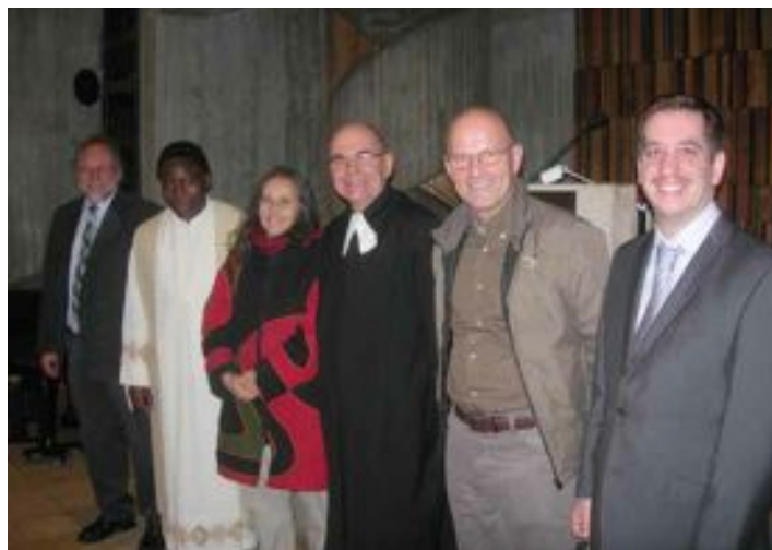
Des sourires évangéliques pendant la Semaine de l'unité des chrétiens.

Au-delà des différences, toutes ces communautés essaient de vivre l'Évangile en suivant les pas du Christ. Pourquoi ne pas essayer de les connaître un peu mieux? C'est souvent l'ignorance qui est à la racine des peurs et des ma-