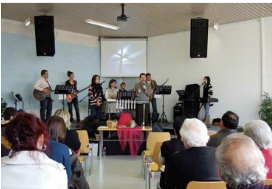
Exemple de culte à Avenches.

Dès 14 ans, les jeunes ont la possibilité de rejoindre le groupe de jeunes Sentinelle qui se retrouve le samedi soir. Le groupe de jeunes Sentinelle organise des soirées avec message, participe à des week-ends intergroupes de jeunes, organise des sorties... En dessous de 14 ans, les enfants ont la pos-