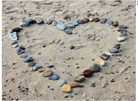
Détente et ressourcement.

Les vacances, c'est super! A condition qu'elles ne se résument pas, notamment pour la maman, à changer de profondeur d'évier et de marque de machine à laver. Pour éviter cela, certaines familles s'orientent vers des formules «tout compris» permettant une vraie pause. Mais d'autres possibilités existent, qui permettent d'allier dépaysement et halte spirituelle. Monastères, associations ou communautés proposent une grande variété d'offres estivales favorisant un vrai ressourcement.