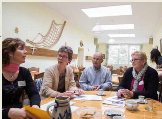
Rencontre des groupes du secteur VD/VS à Bex.