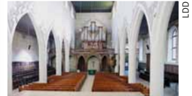
L'église française de Berne.