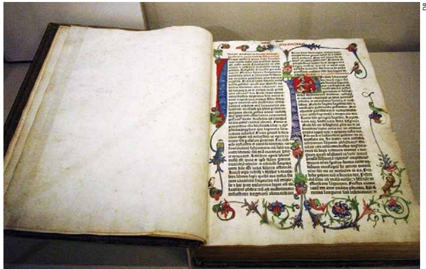
Un livre essentiel.

La Bible du chanoine Osty sera plus proche de l'hébreu d'origine, sans parler de la traduction d'André Chouraqui, quasi littérale et parfois ardue. A l'inverse, la célèbre Bible de Jérusalem et plus encore la traduction liturgique que nous entendons lors de nos messes ont été conçues pour être plus fluides à la lecture, et plus poétiques. Quant à la Bible en français courant ou