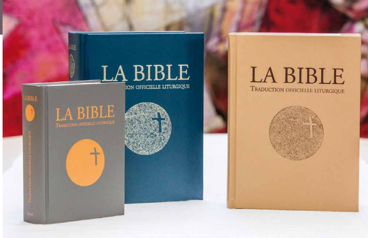
Une nouvelle traduction de la Bible en plusieurs formats.

Dieu qui ne se lasse jamais de chercher l'homme, celle d'hommes et de femmes toujours invités, aujourd'hui encore, à lui répondre».