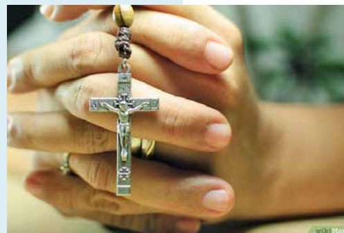
Le Carême, temps de croissance spirituelle.

Nous sommes invités à vivre intensément la liturgie de la parole de chaque célébration eucharistique. C'est aussi le moment d'une écoute attentive de Dieu à travers la Lectio Divina où l'on découvre ce que Dieu attend de nous. Nous devons imiter le Christ à travers les grands moments de sa vie et faire la route avec lui comme un ami de tous les jours, un frère en humanité qui nous comprend mieux que nous-mêmes. Ce faisant c'est vivre une certaine intimité avec Lui. La prière de l'Oraison et aussi les pèlerinages sont autant de voies pour nous aider à l'école de la grâce, de vivre chrétiennement notre temps de Carême.