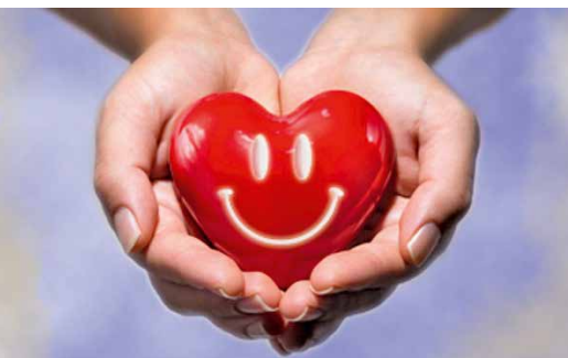
Le Carême, temps de générosité.