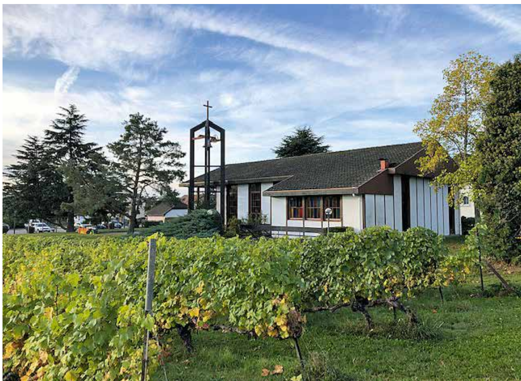
Avant la préparation du terrain.

d'être ensemble. L'occasion de remercier Dieu pour la vigne, le raisin et le travail des hommes. Nous terminions cette journée de fête par un repas communautaire composé entre autres d'une viande tournée à la broche toute la matinée. C'était devenu une habitude, et les participants réservaient la date de cet événement dès qu'elle était annoncée. C'est donc avec nostalgie et quelques regrets qu'une fois le cycle 2019 terminé avec la chute des feuilles, il a fallu arracher notre jolie vigne pour libérer la parcelle.