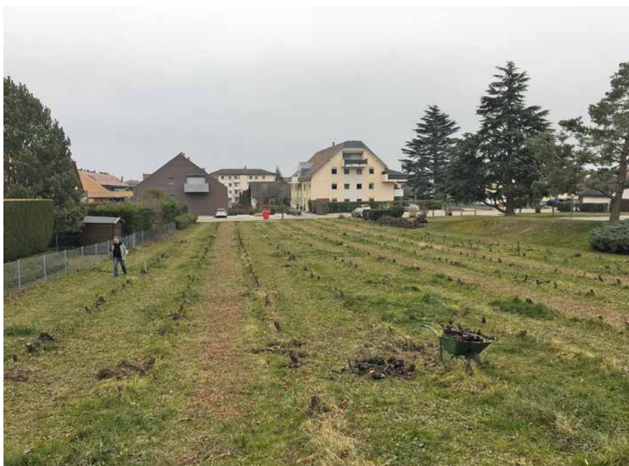
Après le travail effectué en vue de la construction.

Il commencera par une marche méditative en famille sur le thème « Ensemble prendre le chemin vers ce grand projet d'une nouvelle église ». A l'issue de cette marche, enfants, parents et paroissiens de toutes générations et invités du jour seront conviés à la pose de la première pierre. Les détails sur cette journée de fête vous seront communiqués ultérieurement. Une date à réserver dès aujourd'hui!