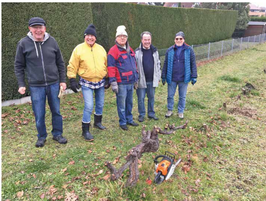
Ensemble, dans la joie, pour préparer le terrain.