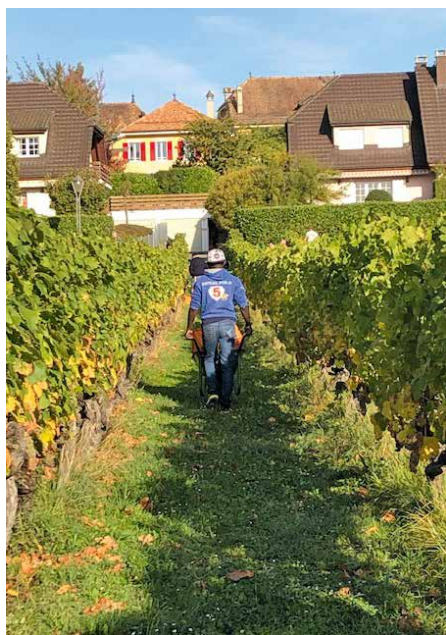
Souvenir des dernières vendanges.

Chaque nouvelle récolte était une réjouissance pour la communauté de Gland, Vich et Coinsins: joie de vendanger et plaisir