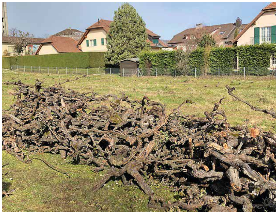
Les souches qui deviendront décor ou feu du 1 er août!

de combustible. Tout ce travail bénévole très apprécié soulagera le premier centre de coûts du devis de construction, soit les travaux préparatoires.