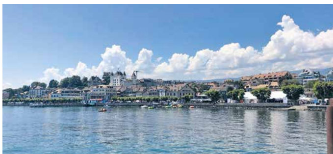
Le bord du lac à Nyon: l'un de mes endroits préférés pour sa douce beauté et l'agréable son du clapotis de l'eau, où j'aime me promener et discuter avec des amis. Vive les plaisirs simples!

Mes parents, l'Eglise et la société m'ont inculqué des valeurs fondamentales dont le respect d'autrui et de la nature. La Terre est un cadeau du ciel inestimable et il est primordial que nous en prenions soin non seulement par solidarité, mais également par gratitude envers Dieu. Nous avons à disposition une planète qui regorge de merveilles : ne serait-ce que dans notre région, nous sommes choyés. Une magnifique étendue d'eau étincelante abritant tant d'êtres vivants, une vue sur des cimes enneigées en toute saison et des couchers de soleil qui inspireraient bon nombre