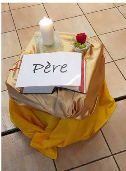
Lors de l'atelier bibliodrame, les différents protagonistes du passage biblique du fils prodigue sont répartis dans la pièce.

Mais il nous arrive d'abîmer la merveille que nous sommes, d'abîmer l'image de Dieu que nous sommes. La tentation nous guette souvent. Elle nous séduit et nous n'arrivons pas toujours à y résister. Nous nous laissons entraîner à faire le mal, nous manquons d'amour pour Dieu, pour notre prochain et pour nous-mêmes. Tristesse et