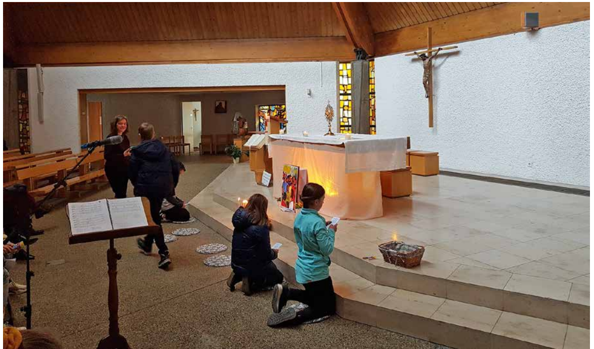
Un temps de prière suivait les confessions.

Pour la sixième année consécutive, l'équipe de catéchèse de l'Unité pastorale (UP) a proposé aux enfants se préparant à la première communion ainsi qu'à ceux des parcours 7P, 8P et 9S de recevoir le sacrement de la réconciliation pendant le Carême.