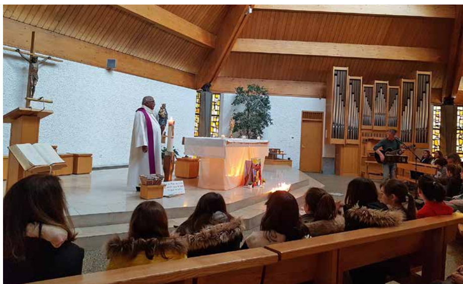
Pour clôturer le temps fort, les familles se sont toutes rendues à l'église pour une prière d'action de grâce.

Pour clôturer la rencontre, tout le monde s'est retrouvé à l'église pour un moment d'action de grâce.