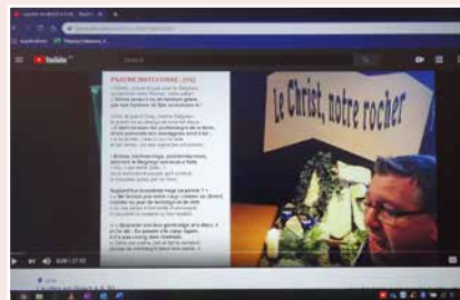
Vincent chantant les Laudès et les Vêpres.