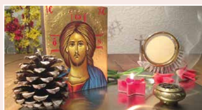
Jean-Marc offrant des moments d'adoration.