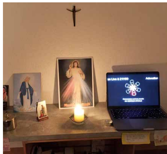
L'ordinateur a rejoint le coin prière.

Oui, nos communautés sont vivantes, l'Eglise est vivante et manifestée partout «où deux ou trois sont assemblés en Son nom» (Mt 18, 20)!