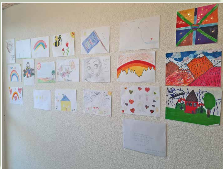
Une partie de la galerie de dessins réalisés par les enfants de la région.

Entre autres nouveautés, il y a eu l'atelier écriture de cartes et de lettres aux proches. Comme ceux-ci ne pouvaient plus venir en visite au home, nous avons aussi mis sur pied des « rencontres virtuelles » par vidéo, ce qui a été apprécié par les résidents et leurs familles. Nous avons ainsi réalisé plus de 150 appels vidéos ! Mais à présent que les visites sont à nouveau autorisées, ces appels vidéos n'ont pas cessé, mais la demande a diminué. Nous en faisons encore et probablement que nous maintiendrons cette possibilité pour les proches vivant à l'étranger ou habitant loin de la région. Il y a également eu, comme nouveauté, l'espace bien-être avec soins au visage, aux ongles, détente... Même si c'est surtout les dames qui sont venues à ces espaces, nous avons également accueilli quelques messieurs ! Comme les messes ont été supprimées, nous avons proposé de répondre au besoin spirituel des gens par un temps de prières, par groupes, à raison d'une fois par semaine.