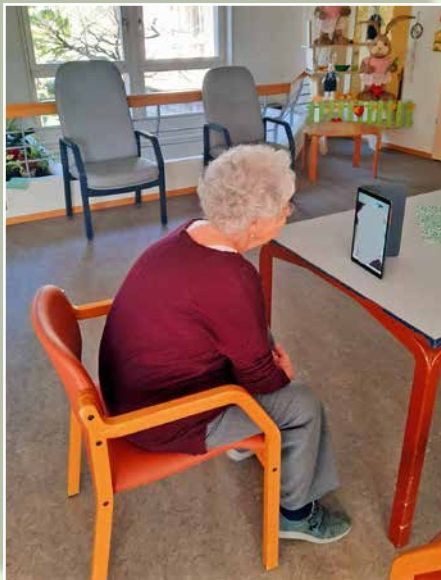
Moment privilégié de contact avec la famille par la vidéo.