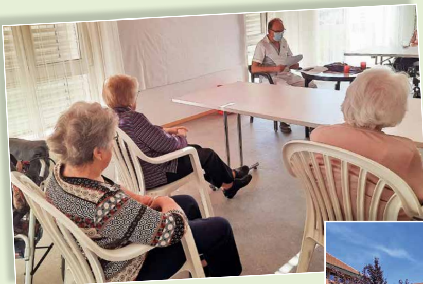
Temps de recueillement dans un étage.