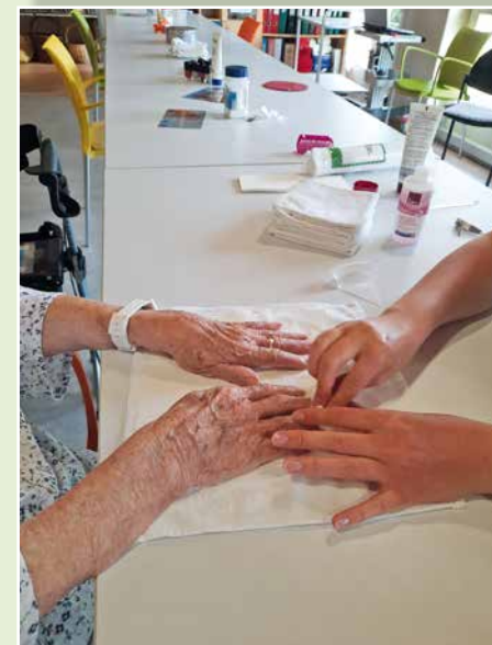
A l'espace « bien-être ».

Au final, malgré les nombreuses restrictions, nous avons beaucoup appris durant cette période et garderons certaines choses par la suite.