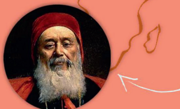
Cardinal Charles Lavigerie