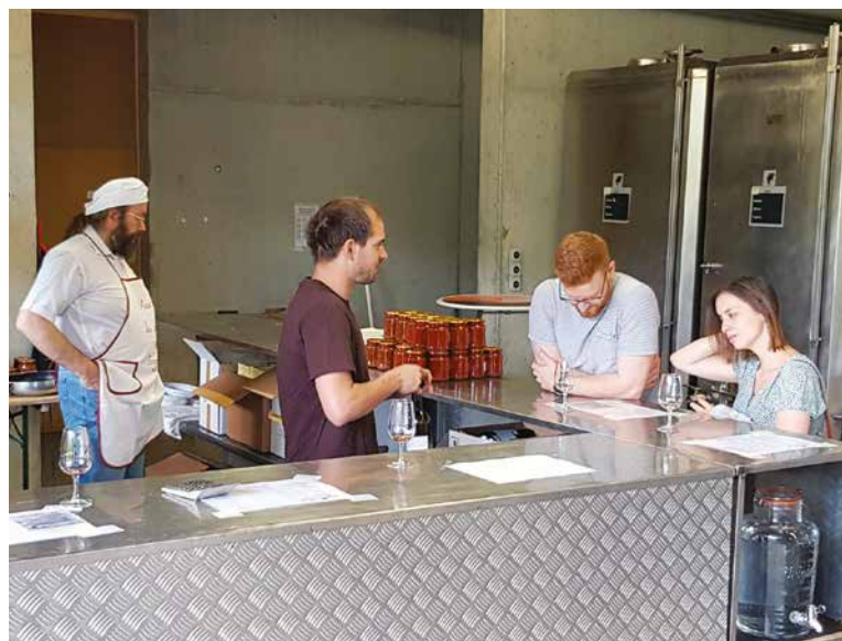
Présentation des produits locaux.