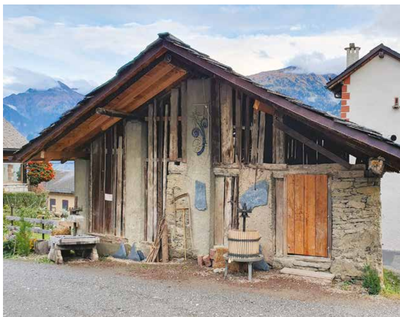
La grange du Château de Vaas.

Le Chemin des pressoirs d'Ollon sera étendu à l'est et à l'ouest par un chapelet de points de production, de vente et d'animation situés le long du Chemin du vignoble valaisan, entre le Château de Villa et le Lac souterrain de Saint-Léonard. Il sera mis en