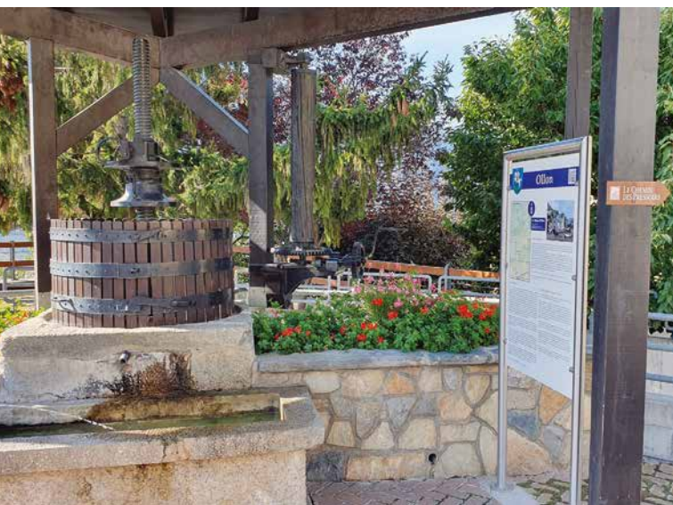
Le Chemin des pressoirs d'Ollon.