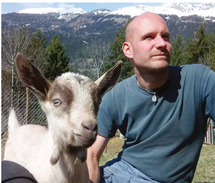
La Fermette à Didi.