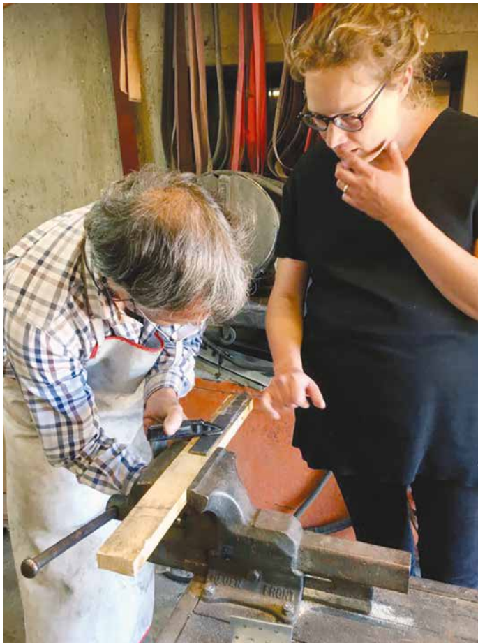
Le Forgeron & La Bergère.

hébergement proche de la nature. Une fromagerie est en projet chez les Cordonier à Lens et des promenades avec les yaks sont proposées à Chermignon par les Wyssenbach avec Yakà ôser .