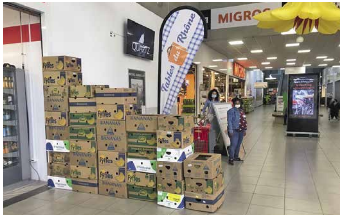
Le stand Caddies au Quartz. On attend fébrilement les clients...