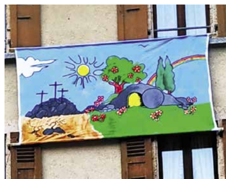
Messages colorés et lumineux.