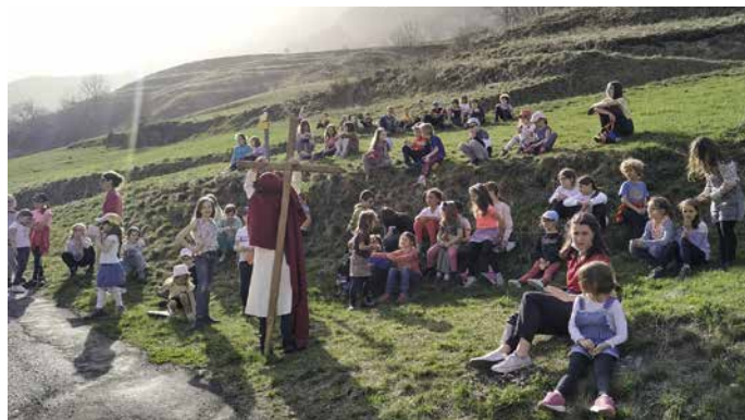
Chemin de croix sur les hauteurs du village.