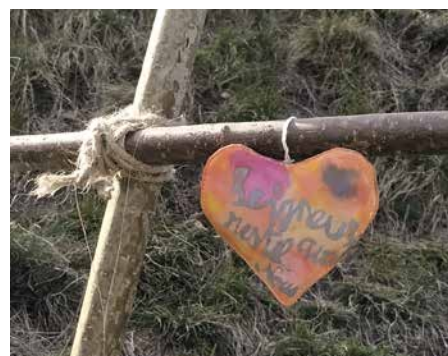
Quand c'est demandé avec cœur.