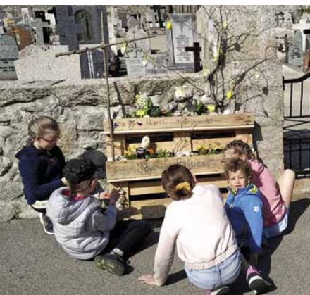
En admiration devant la déco.