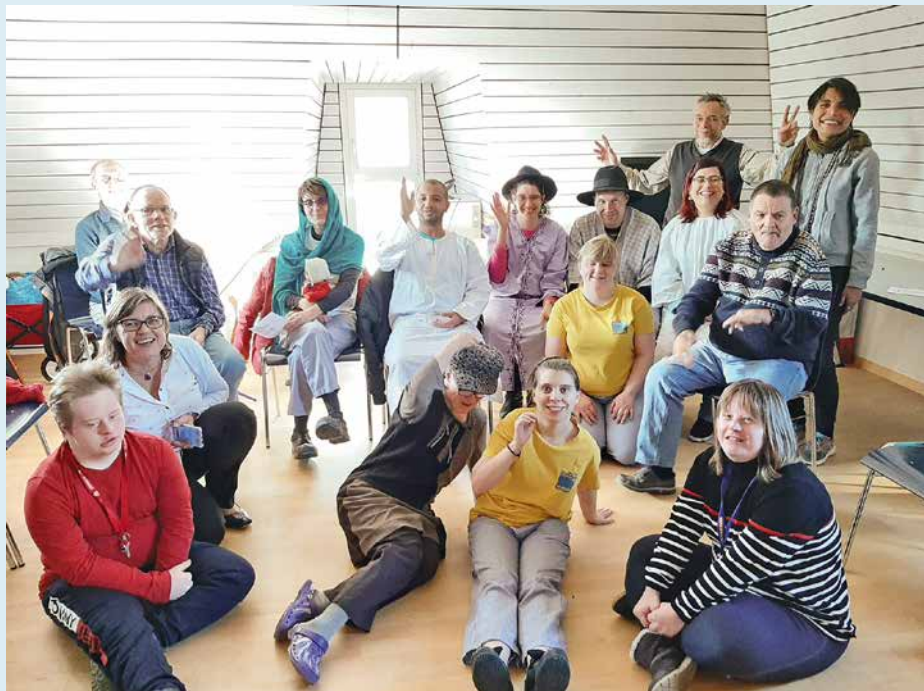
Photo d'archive d'une cérémonie de Noël à «La Rosière». Celle de cette année a malheureusement dû être annulée en décembre dernier à cause des mesures sanitaires.