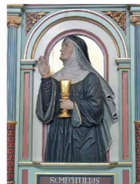
Saintes Hildegarde de Bingen et Mechtilde de Magdebourg... deux femmes engagées qui priaient Dieu au féminin

La question du «genre» de Dieu n'est donc pas une question farfelue ou futile propre à notre troisième millénaire et portée par quelques théologiennes éco-féministes. Dans les années 1970, une théologie féministe chrétienne (la plupart de ces théologiennes sont catholiques 1 ) revendiquait déjà l'utilisation d'un langage épïcène pour parler de Dieu, parce que ce langage permettait peut-être d'aller au-delà de nos représentations visuelles du Dieu masculin tout-puissant véhiculées par une pensée ambiante à dominante patriarcale.