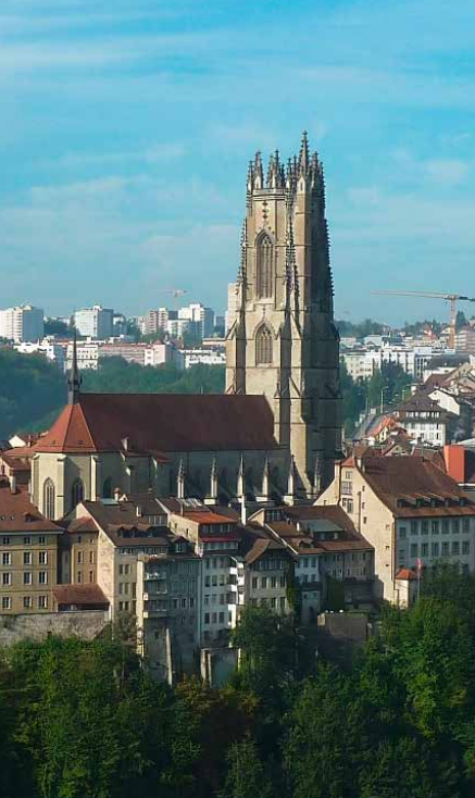
La cathédrale Saint-Nicolas appartient à l'Etat de Fribourg.

« Ainsi même si l'Eglise catholique en Suisse romande ne vole pas la palme aux CFF en matière de propriété foncière, compte tenu du caractère fractionné de ses possessions, elle n'a néanmoins pas besoin de désacraliser à outrance ses édifices religieux pour trouver de nouvelles liquidités. »