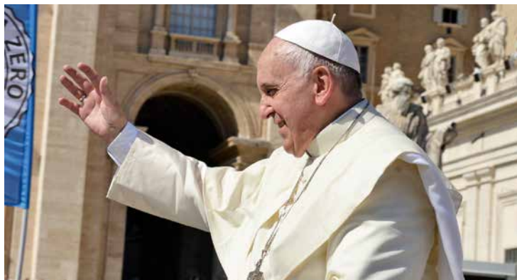
Le pape François a entamé un travail de transparence sur les biens de l'Eglise.

« Les biens temporels que l'Eglise possède ont comme fin le culte divin, le soutien honnête du clergé, l'apostolat et les œuvres de charité spécialement au service des pauvres... »