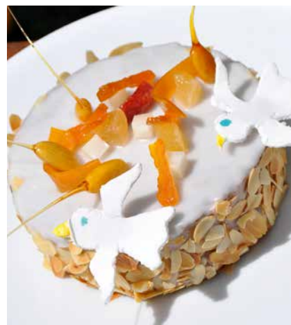
La naissance de ce gâteau aux multiples légendes et recettes n'est pas claire.