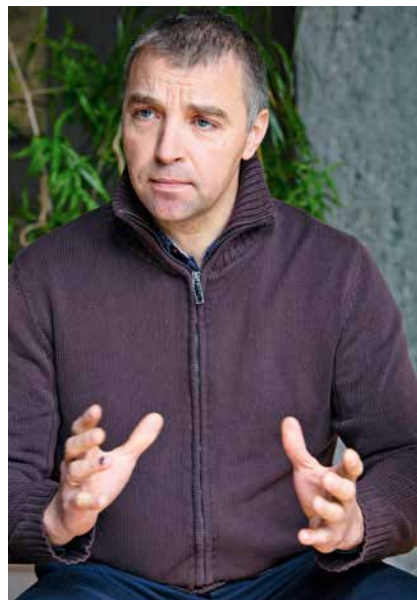
Il est né dans la ville ukrainienne de Zhytomyr.

Si l'Ukraine arrive à repousser les soldats russes hors de son ter-