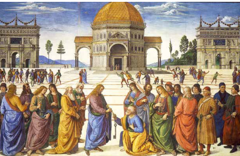
Remise des clefs par le Christ à saint Pierre... sur lequel il bâtira son Eglise.

Car tous ceux qui adhèrent au Christ sont maintenant considérés comme aptes à offrir des sacrifices spirituels que le Père agrée pleinement (2, 5b). C'est ainsi qu'ils reçoivent des noms prestigieux, en devenant comme Jésus, prêtres, rois et prophètes: ils bénéficient d'un « sacerdoce royal »; ils forment une « race élue », jouissant de la miséricorde céleste; une « nation sainte », participant de la nature divine (2 Pierre 1, 4); un « peuple de prophètes, acquis » pour proclamer les louanges du Créateur et Rédempteur de l'univers (Isaïe 43, 20-21) et appelé à rayonner de sa lumière. S'il y a besoin de sauvegarder les bâtisses et chefs-d'œuvre architecturaux hérités de l'histoire, c'est pour que chaque membre du peuple élu s'y trouve « à demeure » et y fasse monter son action de grâce.