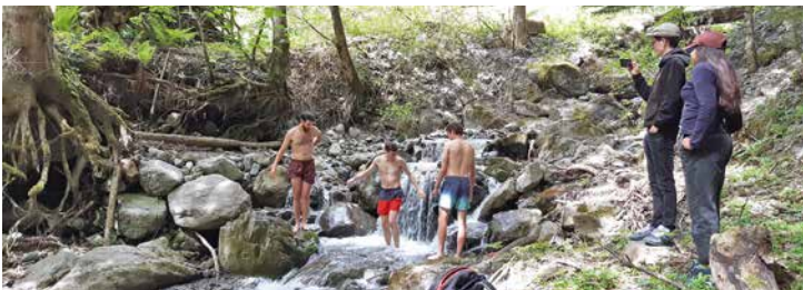
Sous le village de Morcles, le torrent invitait les plus courageux à la baignade.