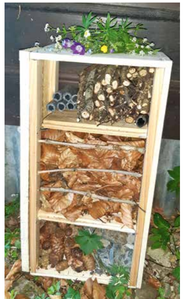
Grâce à l'atelier bien outillé du papa d'Arnaud, les jeunes ont passé un long moment de bricolage. Ici l'une de leur construction : un hôtel à insectes.