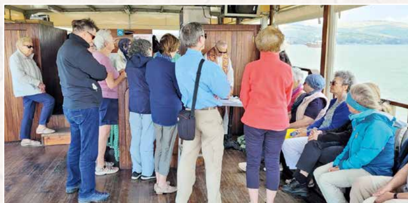
Un bateau sur Tibériade, lieu insolite pour célébrer une messe.