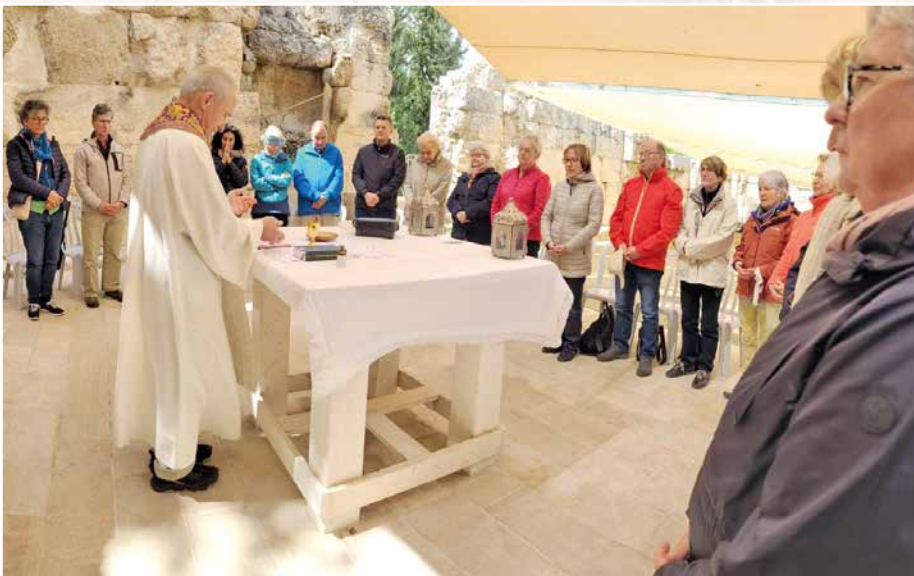
La dernière messe célébrée dans ce lieu de rencontre entre le Ressuscité et les compagnons d'Emmaüs est particulièrement émouvante.