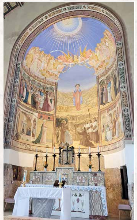
Fresque à Notre Dame de la Visitation, l'une des nombreuses églises visitées.