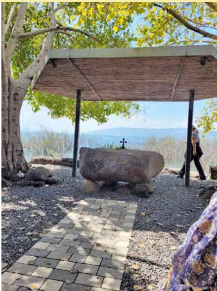
Vue sur le lac de Tibériade, un lieu authentique et inspirant.