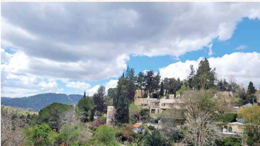
Certains lieux ressemblent davantage à ce qu'on avait imaginé.

Césarée, ville aux vestiges romains et son port qui borde la méditerranée. »