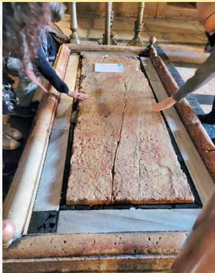
La pierre d'onction où Marie de Magdala a embaumé le corps de Jésus: un lieu d'une intense émotion.