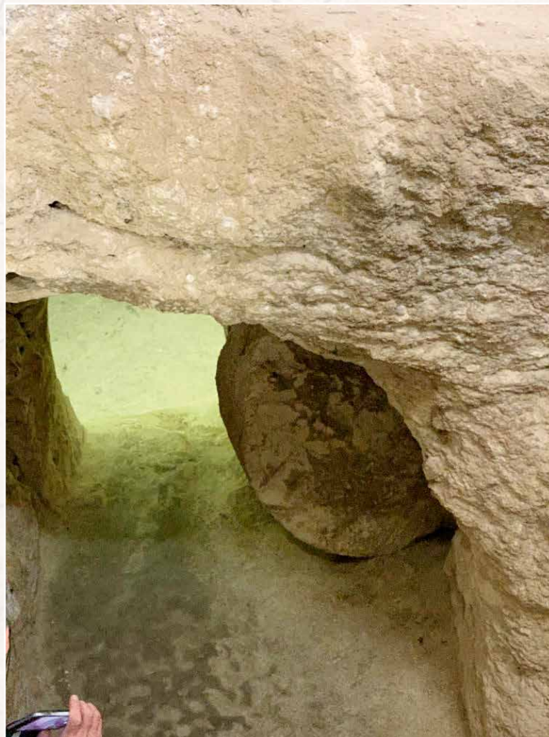
Devant le tombeau de Joseph, à Nazareth, « on a roulé la pierre » (Lc 24,2) prend tout son sens.

Cette découverte de la Terre Sainte est une expérience riche que tous les trois recommandent en voyage organisé avec un guide local. La Parole de Dieu résonne autrement depuis, en écho aux souvenirs qui les habitent.