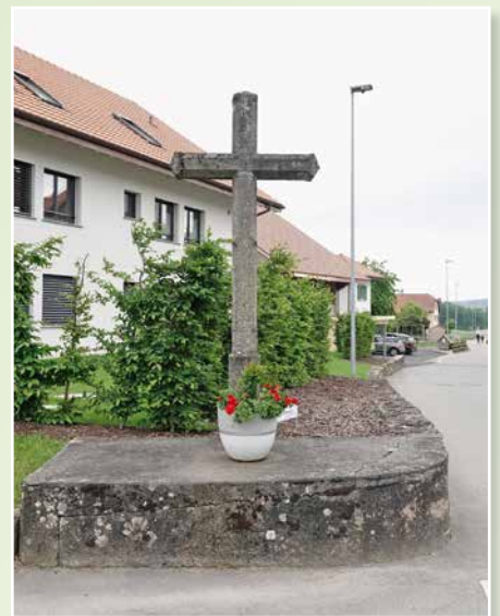
La croix des missions à Sévaz.