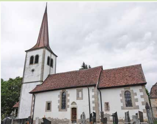
L'ancienne église de Montbrelloz.

à gauche pour rejoindre le chemin de l'aller ou reprendre simplement le chemin de l'aller. Ce parcours fait environ 6 kilomètres.