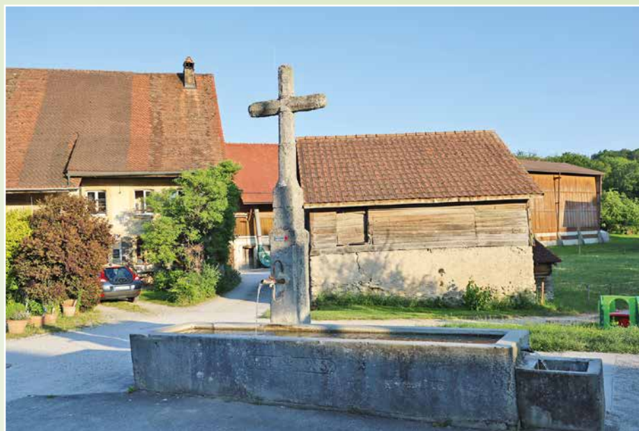
Au cœur du village de Nuvilly.

A toutes et tous un bon pèlerinage... que le Seigneur comble vos demandes de ses grâces.