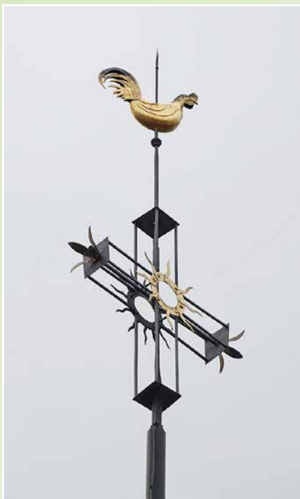
La belle croix et son coq de l'église de Montbrelloz.