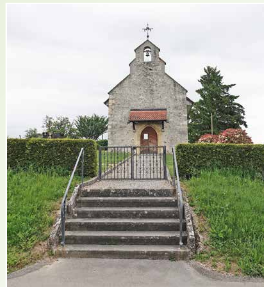
La jolie chapelle de Sévaz.