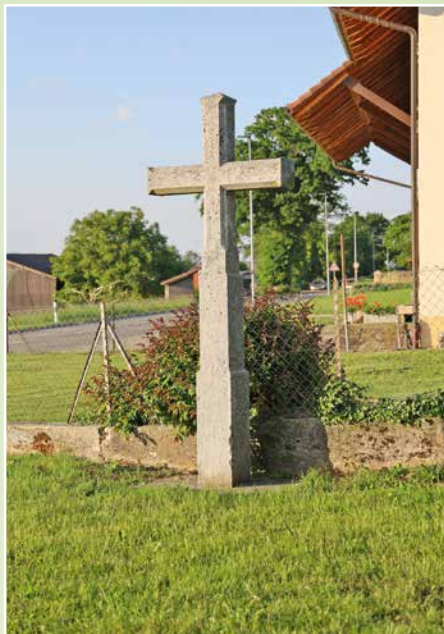
Croix sur les hauts d'Aumont.