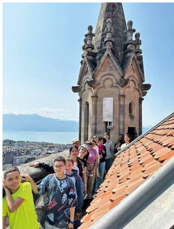
Quelle vue au sommet du beffroi.