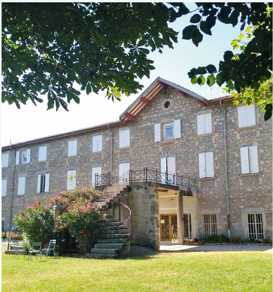
Maison Nazareth de Chabeuil.

Le planning est affiché: la diane musicale est à 6h45 afin de suivre les Laudes de 7h10 avant le petit déjeuner de 7h30. Puis nous avons des périodes d'enseignement, de méditation et de repos alternés, qui rendent les journées agréables et sont orientées sur le but de la retraite: renforcer sa Foi.