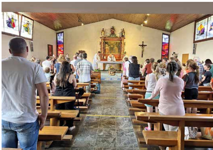
Messe de la Patronale célébrée par le curé, entouré de ses deux vicaires.