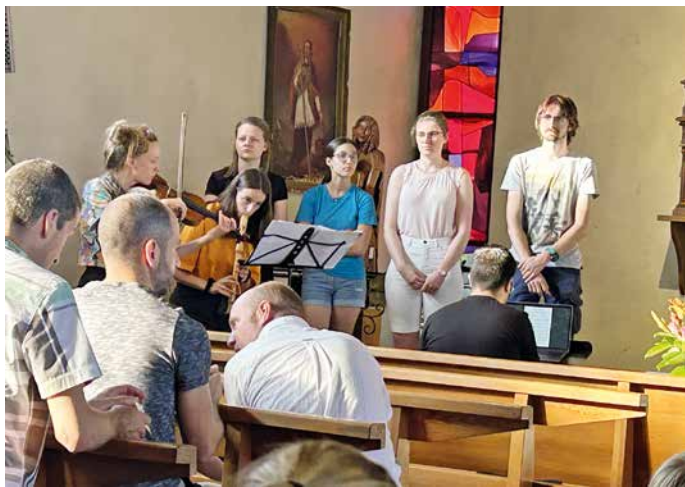
Petite chorale des Jeunes du Chablais.