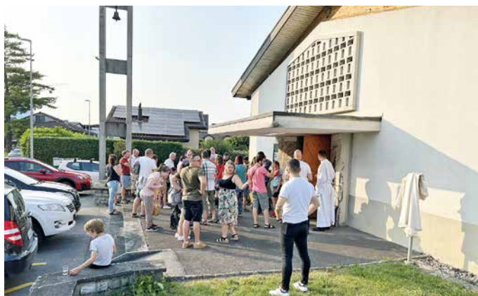
La verrée après la messe.

Signalons qu'une année jubilaire a commencé avec saint Bernard de Mont-Joux, appelé aussi saint Bernard des Alpes ou encore saint Bernard de Menthon (1020-1086) (à ne pas confondre avec saint Bernard de Clairvaux). En effet, le 15 juin 1923, jour de la fête liturgique de saint Bernard du Mont-Joux, le pape Pie XI, a proclamé « notre » saint, patron des alpinistes et des habitants de la montagne. Pour marquer ce centenaire, la congrégation des chanoines du Grand-Saint-Bernard va mettre à l'honneur, une année durant, leur saint Patron, du 15 juin 2023 au 28 août 2024 (jour de fête de saint Augustin, second patron des chanoines).