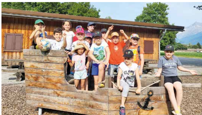
Les enfants de la catéchèse ayant participé à l'après-midi récréatif au couvert du Bochet.