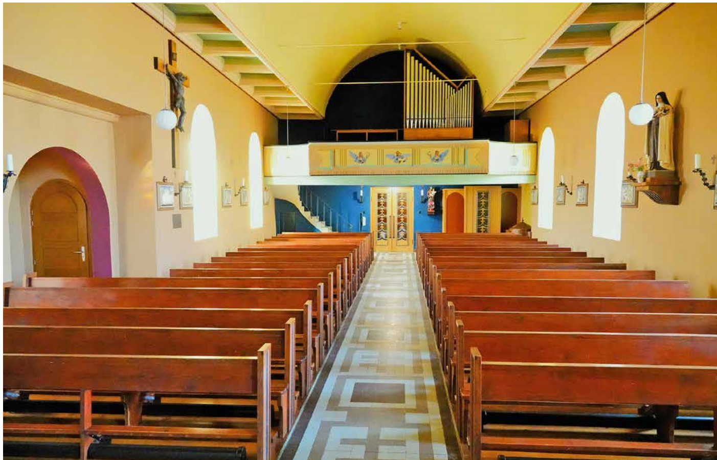
Une restauration qui a donné toute sa splendeur d'antan à l'église de Rueyres.