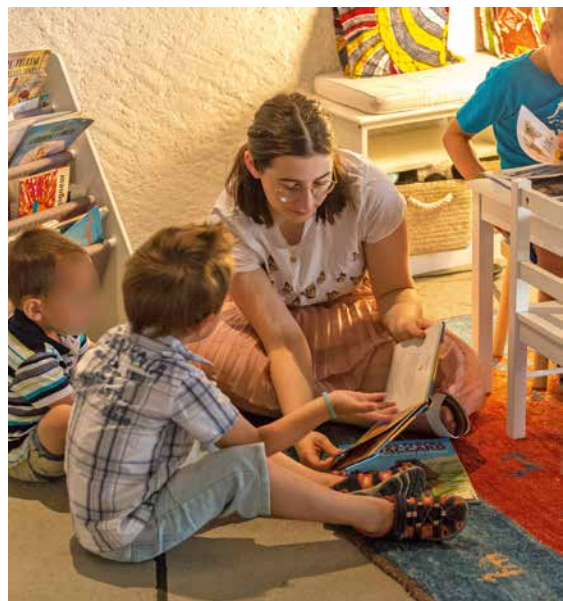
« Jésus nous parle aujourd'hui et de manière personnelle. » F. Lamon

Les expériences, plus nombreuses encore, se vivent dans le domaine de la charité, de l'attention au prochain, de l'amour fraternel jusqu'au pardon au nom de Jésus. Ici sur terre, foi et catéchèse sont faites pour vivre ensemble, au ciel seul l'amour demeure !