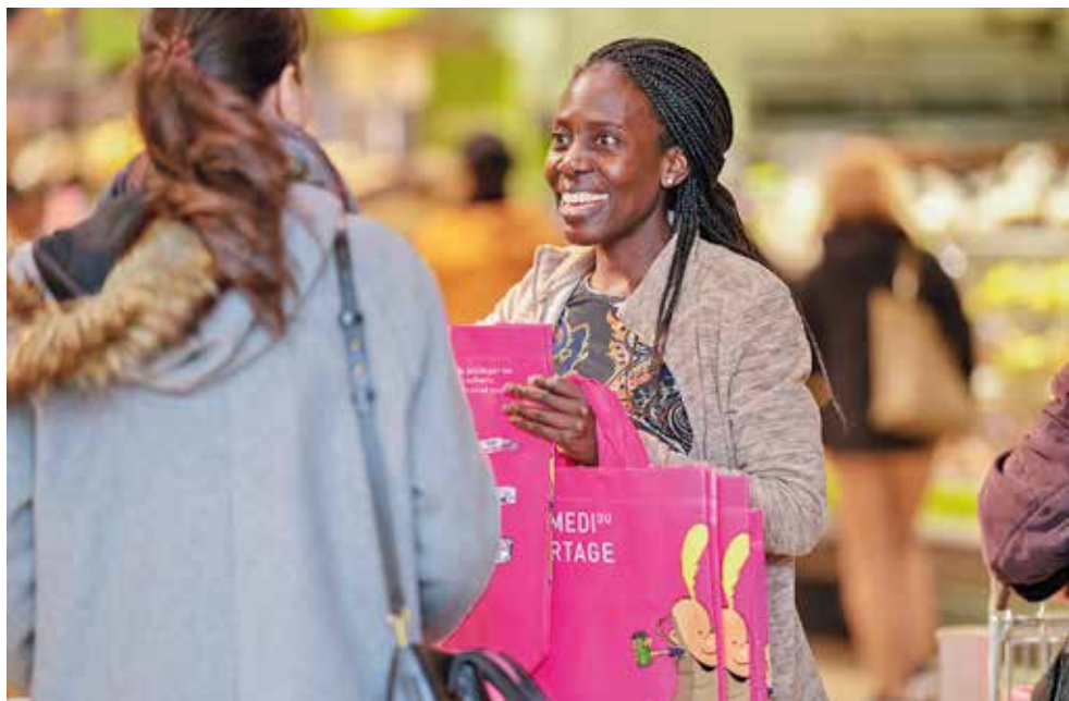
Des actions comme Le Samedi du partage « catéchisent » en actant l'amour du prochain.