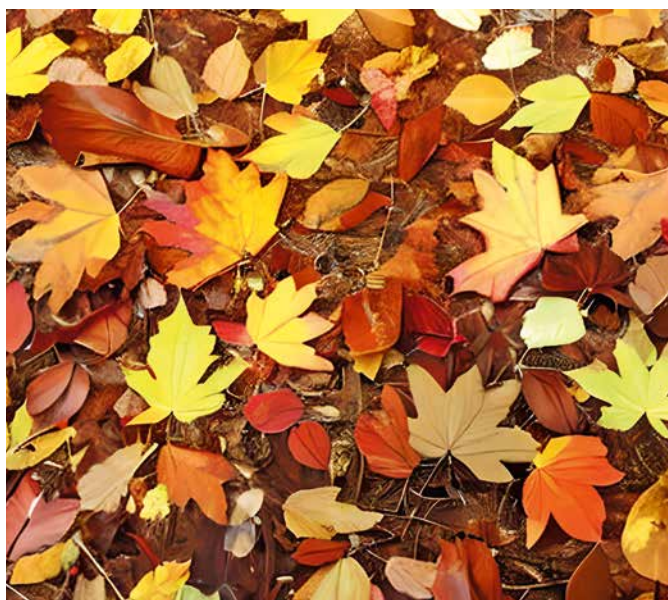
Les feuilles d'automne...

Bon courage pour balayer les feuilles d'automne... Bonne route dans ce magazine pour se reconnecter à L'Essentiel!