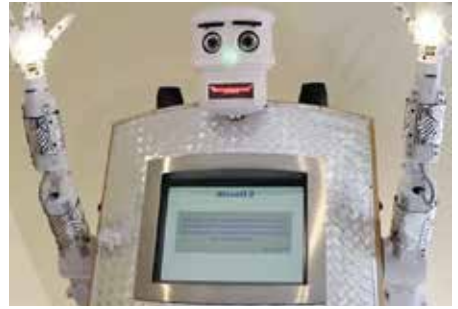
Le robot BlessU-2 de l'église protestante allemande est capable de donner quatre types de bénédiction.

Cette intelligence artificielle (IA) a engendré des robots capables de donner des bénédictions. Le robot BlessU-2 de l'église protestante allemande est capable de parler sept langues en alternant voix de femme et voix d'homme et de donner quatre types de bénédiction : traditionnelle, amicale, d'encouragement et de renouveau. La machine serait-elle une solution à la diminution du nombre de prêtres et de pasteurs ? Nous ne le pensons pas : l'exemple BlessU-2 est techniquement intéressant, mais nous questionne sur la dimension spirituelle et éthique de la machine qui est un formidable outil pour démultiplier notre force physique, intellectuelle et spirituelle, mais pas un remplacement de l'Amour de Dieu. C'est pourquoi l'Eglise n'est pas absente de ces débats et interrogations, loin de là : en février 2020 et sur l'impulsion du pape François, plusieurs institutions publiques et entreprises (IBM, Microsoft, la FAO, le gouvernement italien entre autres) ont signé l'Appel de Rome pour une IA éthique. Depuis avril 2021, le Vatican est doté de la Fondation RenAIssance, une ONG dont la mission est d'encourager à une réflexion éthique de l'IA. Le prêtre et moine franciscain Paolo Benanti, docteur en théologie morale et conseiller du Pape en matière de haute technologie et en par-