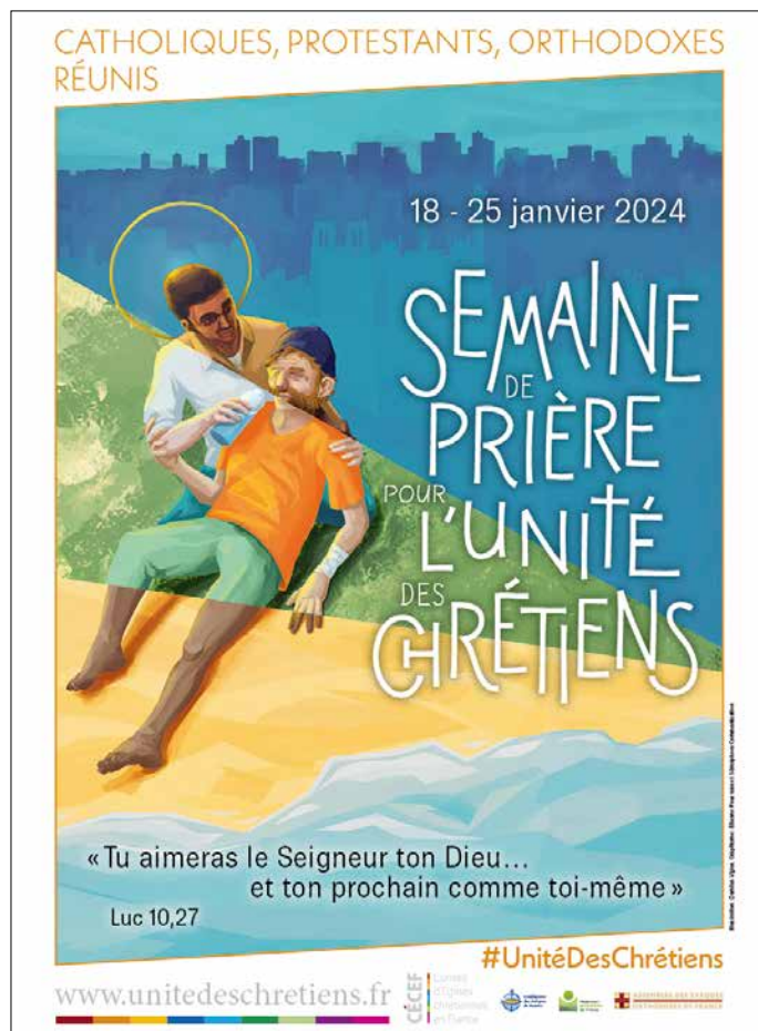
Affiche officielle de la semaine de prière 2024.