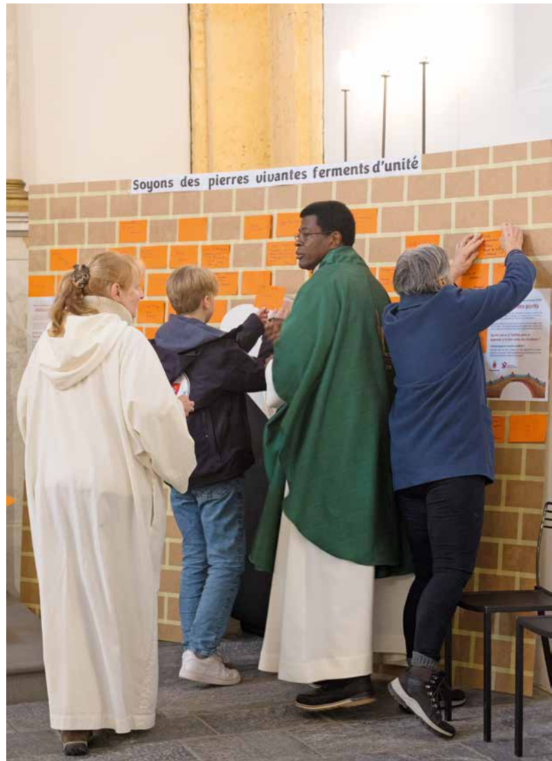
La semaine de l'Unité 2023 avait été marquée par une démarche œcuménique participative à Saxon et à Martigny.

Toutefois, « l'amour de terrain » que Jésus nous présente dans sa parabole est battu en brèche dans le monde d'aujourd'hui. Guerres dans beaucoup de régions, déséquilibres dans les rela-