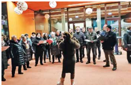
La Chorale de Muraz.