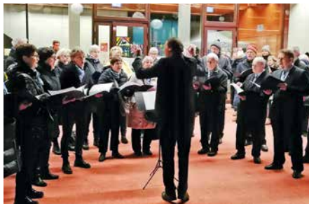
Le Chœur mixte de Collombey.