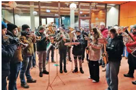
La fanfare «Les Colombes» de Collombey.