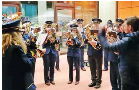
La fanfare «La Villageoise» de Muraz.