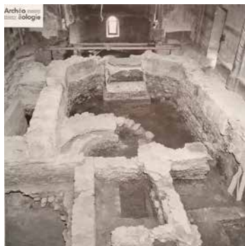
A partir d'une photo prise lors de la rénovation de l'église en 1972.

La rénovation de l'église paroissiale de Muraz en 1972 a mis à jour dans son sous-sol des vestiges de différents édifices : d'abord d'une villa romaine du I er siècle, puis d'une seconde villa romaine, puis d'un premier oratoire vers le VI e siècle, puis d'un second oratoire ou chapelle, puis d'une église du XVII e siècle, puis de l'église démolie à la fin du XIX e siècle.