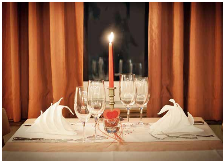
S'offrir du temps à deux.