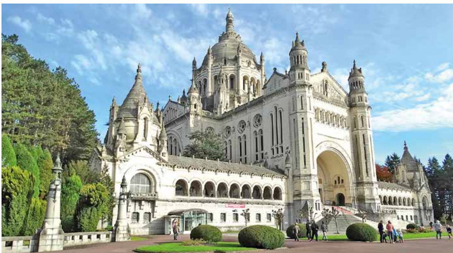
La basilique Thérèse de Lisieux, qui fait partie du programme de ce pèlerinage des jeunes.

Merci au Conseil de paroisse qui soutient ces jeunes et bravo à nos servants de messes et jeunes engagés !