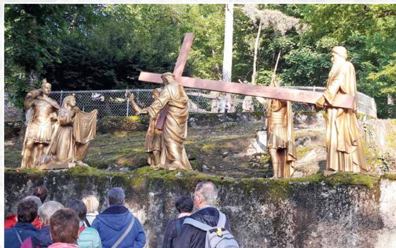
Chemin de croix de Lourdes, Véronique essuie la sainte Face de Jésus.

Une dévotion qui a été bénéfique pour des générations de chrétiens, pourquoi ne le serait-elle pas encore aujourd'hui ? en méditant les différentes stations du chemin de croix, nous contemplons le Christ, souffrant par amour pour nous, injustement condamné à mort et embrassant la croix, son instrument de supplice, employant ses ultimes forces « à faire le bien », à prodiguer des conseils pleins de sagesse (aux femmes disciples de Jérusalem), à se relever de ses chutes, pour s'immoler enfin sur l'autel de la croix. Nous le voyons en outre rencontrant sa sainte Mère, aidé par un passant (Simon de Cyrène), consolé par une femme disciple (Véronique), dépouillé de ses vêtements, étendu sur le bois de la croix, crucifié, agonisant trois