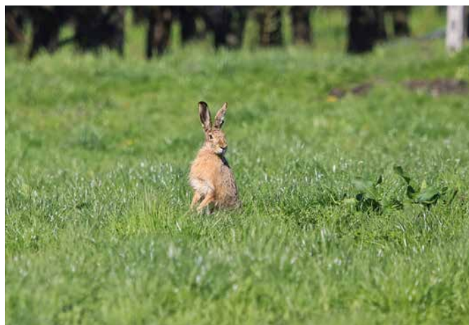
Un lièvre du 1 er avril.