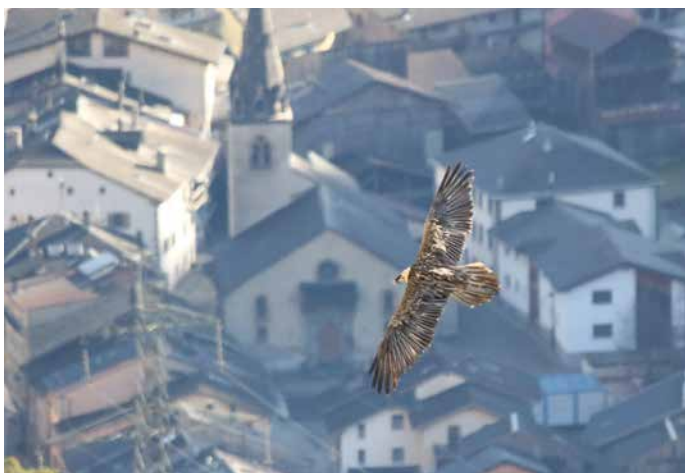
Un gypaète volant près de l'église de Sembrancher.

Dans l'Encyclique Laudato si' (2015), le pape François mentionne saint François d'Assise et son rapport à la nature, un véritable exemple pour tous ceux qui ont été appelés à la chérir et à la sauvegarder. Pour le pape, saint François d'Assise est le saint patron de tous ceux qui étudient et travaillent autour de l'écologie. Celui-ci aurait manifesté « une attention particulière envers la création de Dieu ainsi qu'envers les pauvres et les abandonnées. » [...] « Tout comme cela arrive quand nous tombons amoureux d'une personne, chaque fois que saint François regardait le soleil, la lune, ou les animaux même les plus petits, sa réaction était de chanter, en incorporant dans sa louange les autres créatures. Il entrait en communication avec toute la création, et il prêchait même aux fleurs en les invitant à louer le Seigneur, comme si elles étaient dotées de raison. » (n° 11)