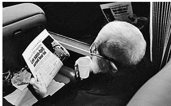
Le combat en faveur des sans-logis.

Bourgeois, résistant, prêtre, député, révolutionnaire, humaniste, star des médias, simple compagnon... Ce petit bonhomme était tout cela. Si le film place la combativité