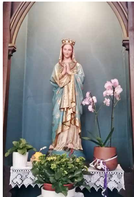
Statue de Marie, église de Monthey.