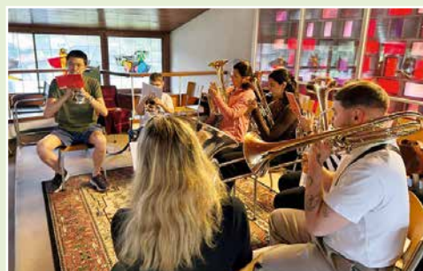
Messe animée par un ensemble de la fanfare, « La Villageoise ».