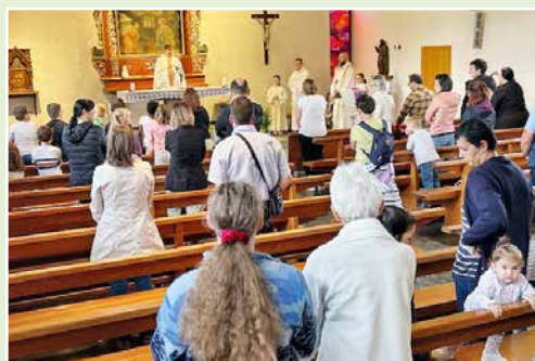
Messe en la chapelle d'Illarsaz.

Merci aux enfants et à leurs parents, merci aux catéchistes pour leurs engagements!