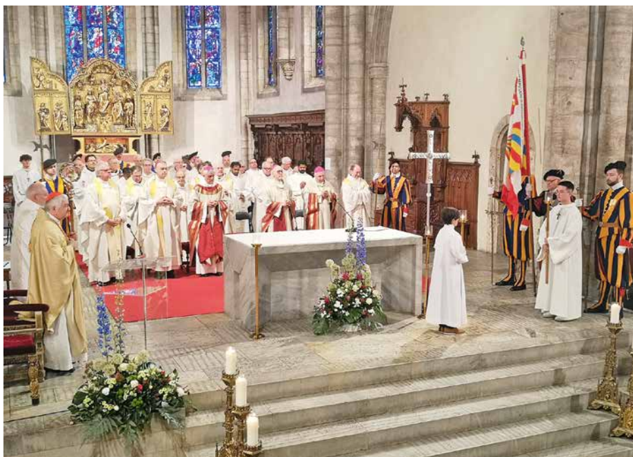
Lors de la messe à la cathédrale.