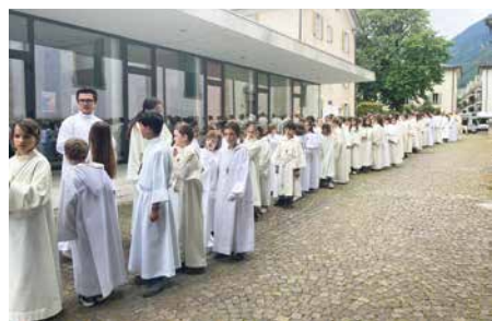
La file des servants avant la messe.