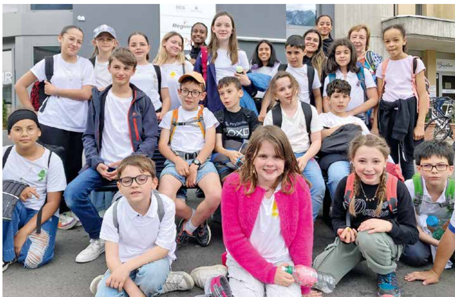
Les servants de messe du secteur de Monthey.

d'orientation religieuse, qui était vraiment bien encadrée, intéressante et amusante.