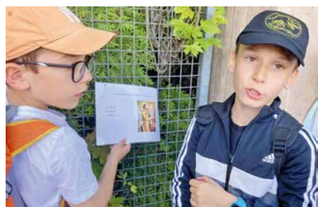
Durant le « Quiz » / jeu de piste.

Les organisateurs nous ont expliqué le déroulement de la journée. Répartis en sept groupes pour 150 servants de messe, nous avons « customisé » nos t-shirts blancs en les bombant. C'était la première étape du grand jeu. Ce dernier était une course