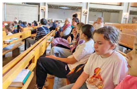
A l'église de Martigny, à l'écoute des explications.