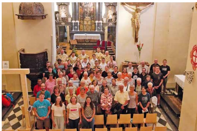
Samedi 17 août dernier au Grand-Saint-Bernard.

Nous avons eu la chance de vivre quelques jours de camp à l'Hospice du Grand-Saint-Bernard avec les jeunes du groupe «En quête de foi». Ce fut l'occasion de nous laisser guider par saint Bernard et sa devise « Hic Christus adoratur et pascitur » ( Ici le Christ est adoré et nourri ). Le verbe « pascitur » a deux significations: « est nourrit » et « nourrit ». Le Christ est à la fois nourri à travers de tous ceux qui sont accueillis à l'hospice et « nourrit » les fidèles en se donnant lors de l'Eucharistie. En résumé la mission de saint Bernard est bâtie autour de quatre piliers: la montagne, la prédication, le service et l'accueil. Nous avons aussi l'occasion de rendre service, lors de la liturgie, par le chant, les lectures, la prière et de bien d'autres façons. Saint Bernard nous invite tous à proclamer la Parole que nous avons reçue durant ces quelques jours de camp. Un autre aspect marquant fut le passage de la porte sainte, placée dans l'église de l'Hospice. Grâce au pape François, nous avons l'occasion de recevoir l'indulgence plénière jusqu'au 15 septembre en la passant. Une occasion de «faire le ménage en profondeur et de recevoir la Miséricorde de notre Seigneur». Le groupe de jeunes «En quête de foi».