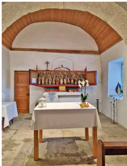
La nouvelle table de la chapelle de Franex.