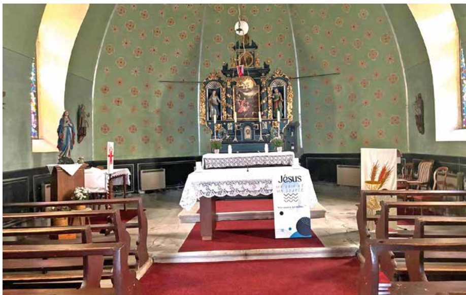
Le nouvel autel de l'église de Prévondavaux.