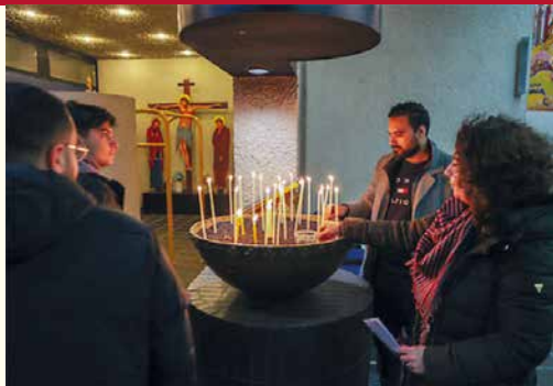
Gebetsabend in Chambésy.

Wer die Evangelien und die Apostelgeschichte aufmerksam liest, wird immer wieder auf Ereignisse stossen, aus denen ersichtlich ist, wie gegensätzlich die Meinungen auch schon unter den Aposteln waren. Sie glaubten zwar alle an Jesus Christus als den verheissenen Messias und seine Botschaft, doch über die Art und Weise wie diese Botschaft nach der Himmelfahrt Christi umzusetzen ist, wurde schon früh gestritten. Erinnern wir uns nur an die heftigen Auseinandersetzungen