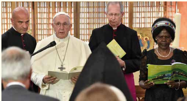
21. Juni 2018: Papst Franziskus besucht in Genf den Welt- rat der Kirchen. Gemeinsamer Einsatz aller Christen für die Ökumene.

Dennoch kann man nicht so tun, als ob es schon jetzt eine volle Einheit zwischen den christlichen Kirchen geben würde. Vielmehr müssen die lehrmässigen Unterschiede zwischen den Kirchen ehrlich benannt und mit Geduld gelöst werden. Für Papst Leo XIV. ist es wichtig, den Einsatz für «volle sichtbare Gemeinschaft» zwischen den Kirchen fortzusetzen. Gleichzeitig wies er darauf hin, dass dieses Ziel – «mit Gottes Hilfe» – nur durch «respektvolles Zuhören und brüderlichen Dialog» erreicht werden könne. Denn die «Trennungen von der einen Kirche Christi entstanden wegen Verfälschungen der Lehre Christi, menschlicher Verfehlungen und mangelnder Versöhnungsbereitschaft – meist bei Vertretern beider Seiten.