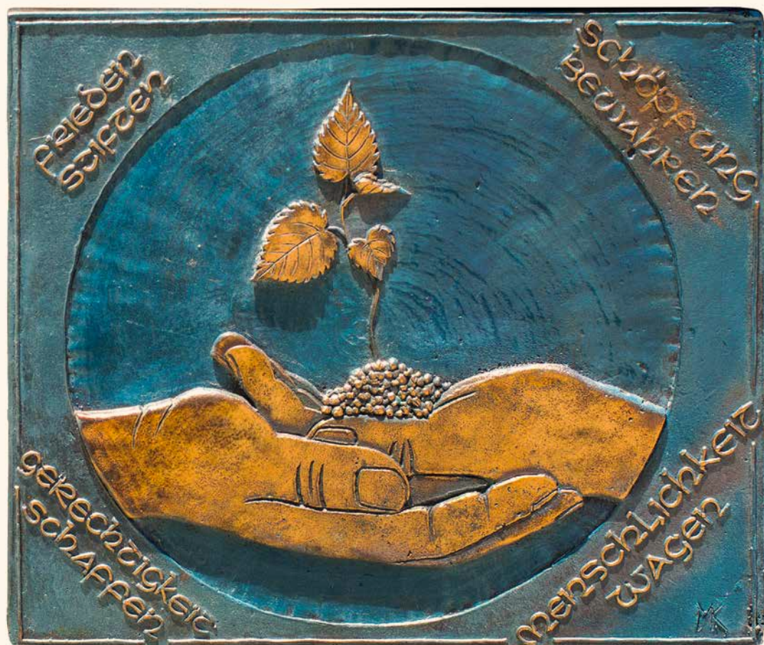
Zwei Hände halten eine junge Pflanze, Amberg

102. Jahrgang – Monatlich ♠ 1–4 und 13–16 Auswahltexte ♠ 5–12 Dossier Augustinuswerk, 1890 Saint-Maurice, Telefon 024 486 05 20