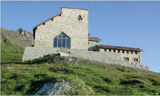
Wallfahrtskirche Ziteil, GR.

Regelmässige Kirchenkollekten, Privatpenden und Beiträge von Kirchgemeinden ermöglichen es der Inländischen Mission (IM) Jahr für Jahr wieder neu, innovative Seelsorgeprojekte und Kirchenrenovationen zu unterstützen. 2024 konnten Beiträge in der Höhe von rund 1,8 Millionen Franken geleistet werden. Sämtliche Spenden werden zugunsten der Projekte ausbezahlt.