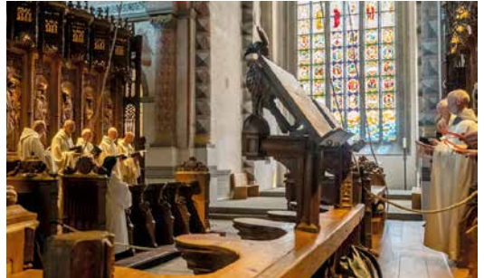
Chorgebet in Hauterive vor dem markanten Glasfenster

Die Abtei Hauterive liegt sieben Kilometer von Freiburg entfernt, eingebettet in eine Saane-Schleife. Ihre Kirche, die Kirche Sainte-Marie, wurde vier Jahre lang renoviert und ist nun wieder offen für Gläubige und Interessierte.