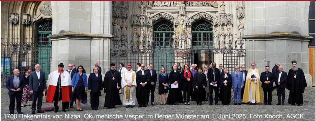
1700 Bekenntnis von Nizäa. Ökumenische Vesper im Berner Münster am 1. Juni 2025.