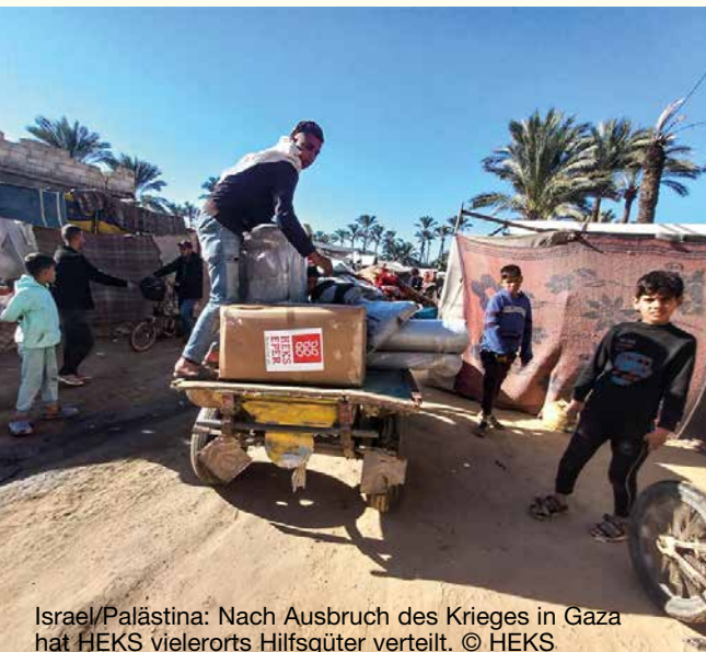
Israel/Palästina: Nach Ausbruch des Krieges in Gaza hat HEKS vielerorts Hilfsgüter verteilt.

Wir können nicht selber vor Ort unsere Hilfe anbieten, wir können aber dem Fastenopfer eine Spende überweisen: