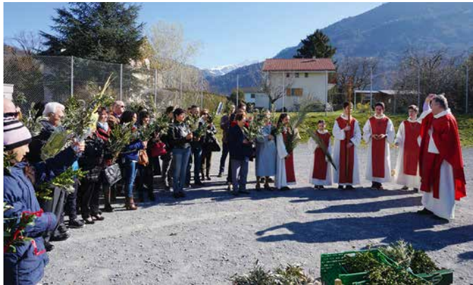
Die Segnung der Palmen in Bex.