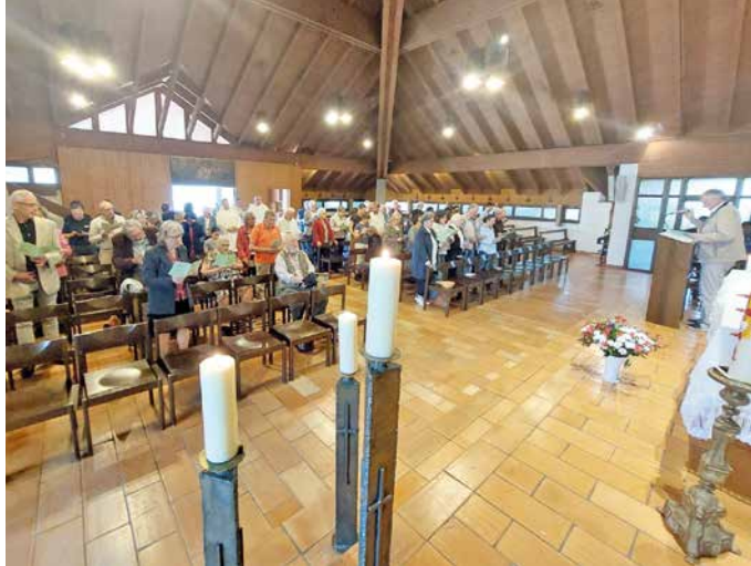
Eglise du Bon Pasteur illuminée.