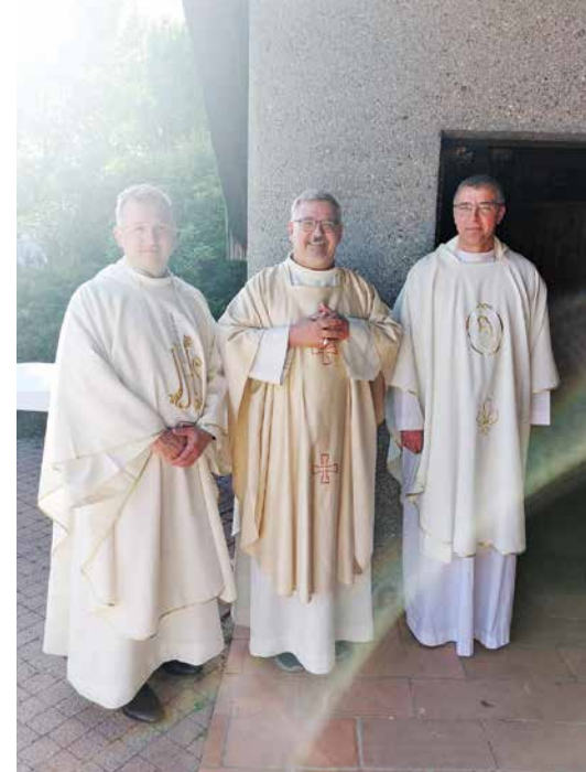
Le trio local!

Réjouir. La liturgie, simple, chantante et joyeuse, n'a pas souffert d'arabesques interminables ou de chichis baroques. Non. La chorale de Chêne-Thônex a prêté son concours, et même si réduite ce jour-là, a animé l'assemblée... qui a cherché un peu son unisson vocal avant de trouver le ton juste. C'est exactement cela, le sens de l'eucharistie: trouver ensemble la note commune pour moduler sa voix dans le concert des chantes de Dieu.